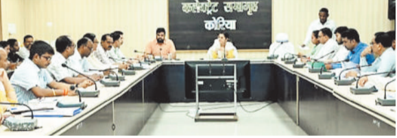
कलेक्टर ने ली टीएल की बैठक

भोजन बनाते समय किस प्रकार सावधानियां बरती जाएं, किसी प्रकार की घटना घटित न हो एवं किचन की साफ सफाई, मसालों के रखरखाव, कुकर का इस्तेमाल करने के पूर्व अच्छे से साफ करने के बाद ही उपयोग करें इत्यादि जानकारी दी गई। विकास खंड शिक्षा अधिकारी ने रसोइयों से कहा गया कि विद्यालय के बच्चों को अपना बच्चा समझ कर गरम एवं पौष्टिक भोजन खिलाएं जिससे बच्चों की उपस्थिति में वृद्धि हो।