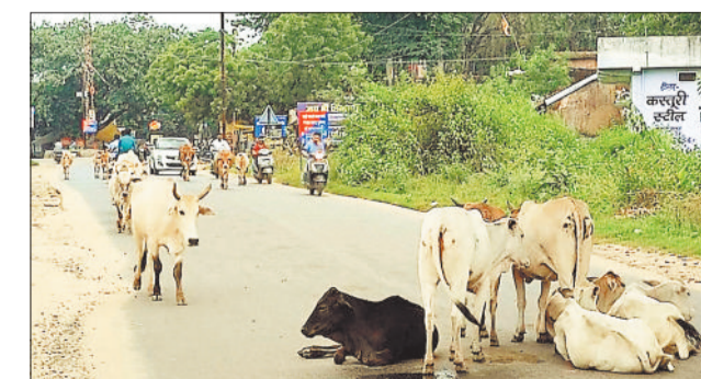
सड़क पर बैठे मवेशी।

इस कारण वाहन चालकों को सड़क पर पशुओं के कारण वाहन चलाने में परेशानी होने के साथ ही दुर्घटना होने की संभावना बराबर बनी रहती है। शहरी क्षेत्र बैकुंठपुर में नपा द्वारा सड़क से पशुओं को हटाने के लिए