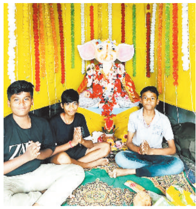
चक्की दफाई डोमनहिल में विराजे भगवान गणेश।