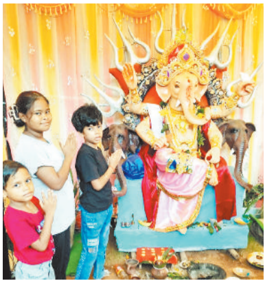
हरिपारा वार्ड क्रमांक 1 में विराजे भगवान श्रीगणेश।