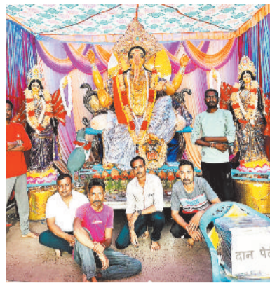
वानर सेना डोमनहिल में विराजे भगवान गणेश।