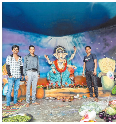
मैरव दल कमेटी डोमनहिल में विराजे भगवानगणेश। मनेन्द्रगढ़ में प्रसिद्ध कला मंत्र गणेश पूजा समिति।