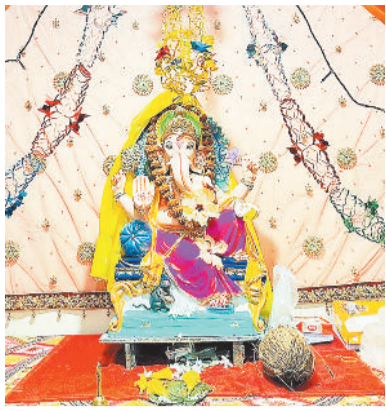
टीचर कालोनी डोमनहिल में विराजे भगवान गणेश।