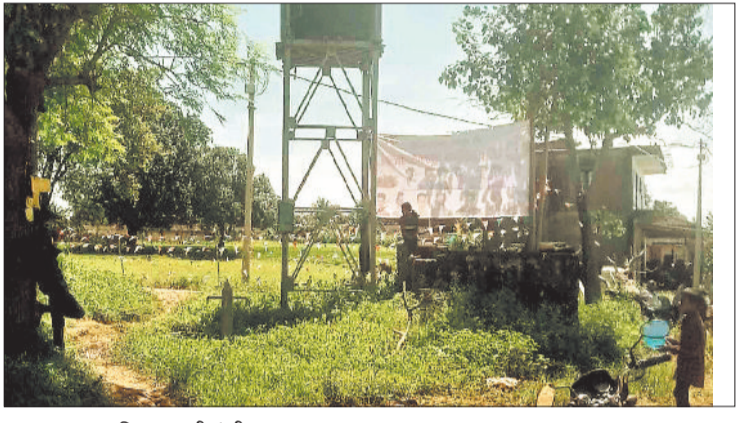
खराब पम्प व क्षतिग्रस्त पानी टंकी।

ग्राम पंचायत गोविंदपुर सोसायटी पारा स्थित उप स्वास्थ्य केन्द्र के समीप हँडपंप में मध्यह्न पंप लगाया गया है और पानी टंकी से उप स्वास्थ्य केन्द्र सहित मोहल्ले के लोग पानी का उपयोग पेयजल के लिए करते हैं। कुछ दिनों पूर्व ही सोलर पंप की पानी टंकी फट गई जिससे पेयजल की सफाई ठप हो गई है। ऐसे में उप स्वास्थ्य केन्द्र आने वाली प्रसूताओं को